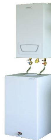
BS 120 l her med WGB EVO 20 I

BS-beholderne er især beregnet til opstilling direkte under en væghængt gaskedel. Alle tilslutninger er opad, og koblingen mellem gaskedlen og beholderen kan derfor udføres enkelt og æstetisk.