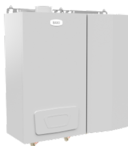
VBF- G 50H her med WHBS 14D