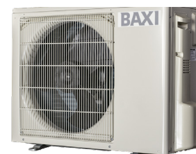
Udedel 6 kW