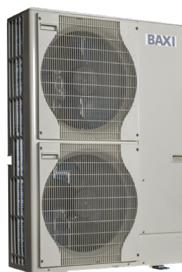
Udedel 11 & 16 kW