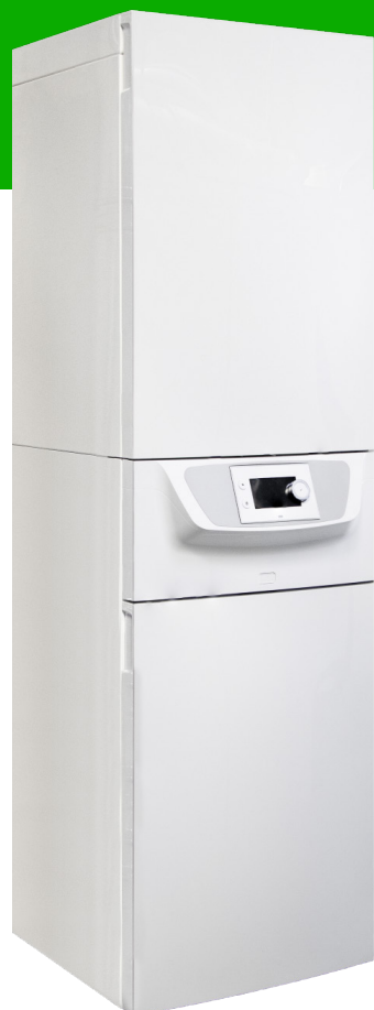
Indedel 6,11 & 16 kW inkl. integreret buffer, 55 liter