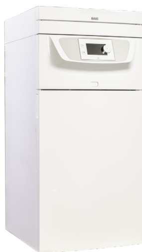
Indedel 6,11 & 16 kW