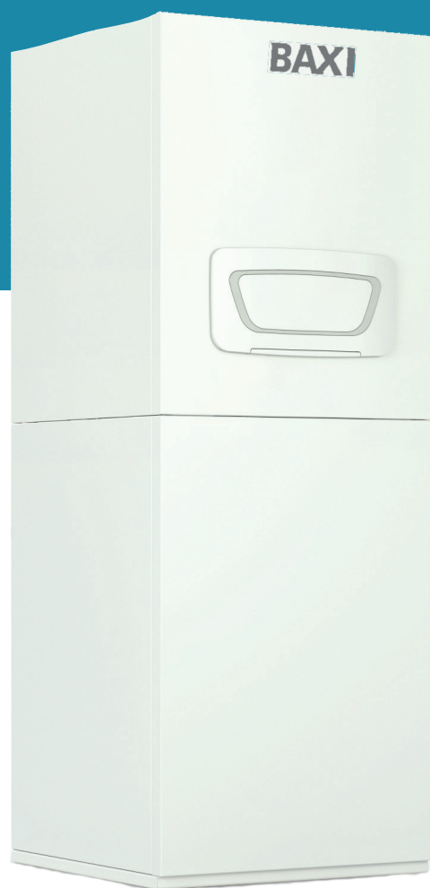
BBS EVO 15 I